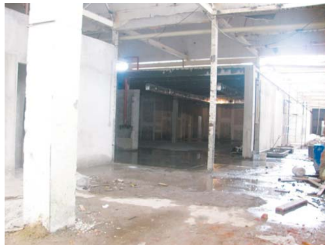
Parte da Cidade da Polícia está na fase inicial das obras

A Cidade da Polícia deveria ser inaugurada em novembro de 2011