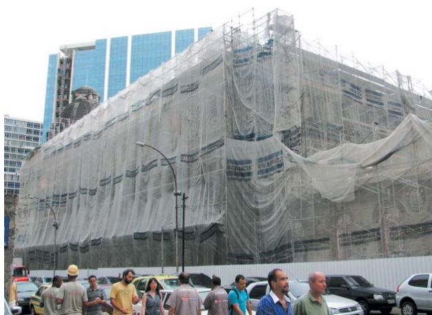
Tanto a fachada quanto o interior do prédio estão sendo restaurados