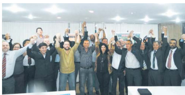
Dirigentes sindicais aprovam greve nacional

No encontro foi discutida a pauta de reivindicações da categoria, que luta pela aprovação da Lei Orgânica da Polícia Civil, que estabelece um plano de cargos