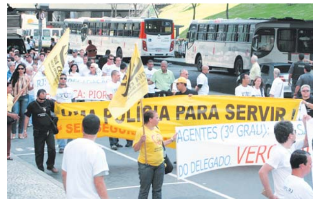
Passeata da Operação Cumpra-se a Lei com a participação da Nova Central

O SINPOL participou da passeata “Cumpra-se a Lei” portando as principais faixas e painéis, junto com as demais entidades da polícia civil no dia 29 de setembro de 2011 – dia do Policial Civil – para reivindicar melhores condições de trabalho e salário. O Sindicato ajudou na convocação da categoria através de carro de som, outdoors, faixas, panfletos, jornal e redes sociais, tendo gastado mais de 40 mil reais.