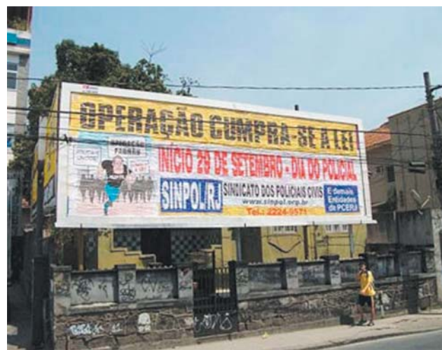
SINPOL garantiu a divulgação da operação cumpra-se a lei com outdoors espalhados pela cidade

Usando camisetas com a frase “Cumpra-se a lei”, cerca de 400 agentes percorreram as principais ruas do Centro do Rio, passando pela OAB, Ministério Público e Alerj onde foi entregue um documento explicando os motivos da manifestação, entre eles o baixo efetivo, a dedicação exclusiva e o pior salário do Brasil.