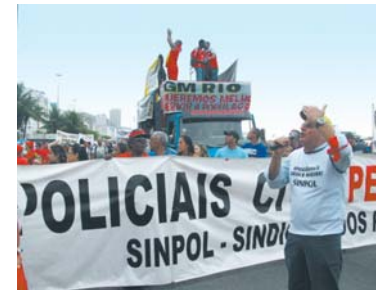
Com faixas e caminhão de som o SINPOL liderou os policiais civis