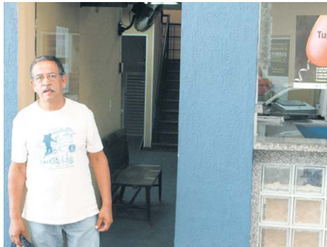
O policial aposentado reclama do espaço improvisado para atendimento