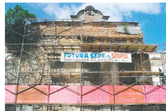
Futura sede do SINPOL

A ação foi movida por três sócios do Bloco Carnavalesco, depois que a prefeitura anunciou a liberação de R$ 2,3 milhões para reformar o imóvel cedido ao Centro Cultural, que pertence a RioTrilhos. Os cinco magistrados acataram as alegações do relator de “perigo de dano irreparável ou de difícil reparação ao erário público”. Outro pedido na ação refere-se à anulação do contrato de comodato que irá a julgamento nos próximos dias.