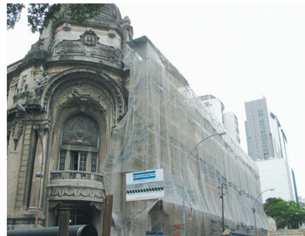
Todo o prédio histórico está sendo reformado

– Desmontadas, as peças são totalmente reparadas para serem remontadas, evidenciando a beleza e o requinte originais. Já está assegurada a reposição de todos os vidros em conformidade com o padrão adotado em 1912 – contou o diretor do museu.